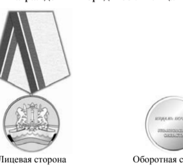
РИСУНОК медали Почета, вручаемой награжденным юридическим лицам

ПРИЛОЖЕНИЕ 3 к Закону Ульяновской области «О правовом регулировании отдельных вопросов, связанных с награждением юридических лиц наградами Ульяновской области»