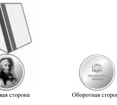
РИСУНОК медали Н.М.Карамзина, вручаемой награжденным юридическим лицам

ПРИЛОЖЕНИЕ 5 к Закону Ульяновской области «О правовом регулировании отдельных вопросов, связанных с награждением юридических лиц наградами Ульяновской области»