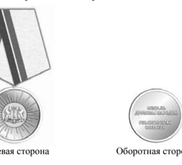
РИСУНОК медали Дружбы народов, вручаемой награжденным юридическим лицам

ПРИЛОЖЕНИЕ 4 к Закону Ульяновской области «О правовом регулировании отдельных вопросов, связанных с награждением юридических лиц наградами Ульяновской области»